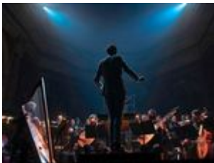
Pygmalion - afbeelding rechtenvrij - fotograaf Fred Mortagne.jpg